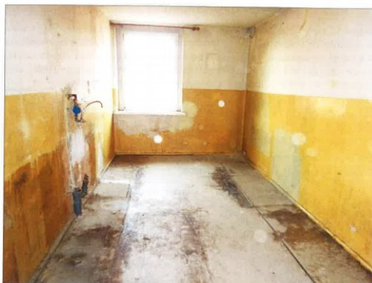
Widok fragmentu kuchni.