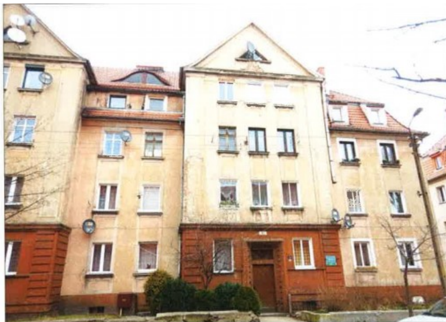
Widok elewacji frontowej– ul. Juliusza Słowackiego nr 15b.

na sprzedaż lokalu mieszkalnego Nr 14 znajdującego się w budynku położonym w Lubaniu przy ul. Juliusza Słowackiego 15a wraz z udziałem we współwłasności nieruchomości gruntowej (działka nr 58/11, AM 14, Obręb I o powierzchni 201 m 2 , JG1L/00020148/5)