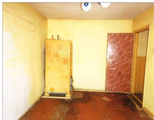
Widok fragmentu pokoju.